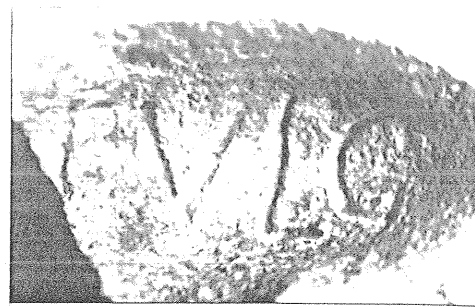
Fig. 2 — Paris, rue Saint-Martin: moule à balles de fronde en plomb, détail de l'inscription.

La forme recherchée – glands ovoïdes simples légèrement appointés en forme d'ogive – correspond au type Ic de Th. Völling (1990). Cette forme courante, attestée du 2 e s. av. J.-C. au 2 e s. ap. J.-C., ne saurait contribuer directement à la datation. Le seul indice réside dans son module important, supérieur à la plupart des